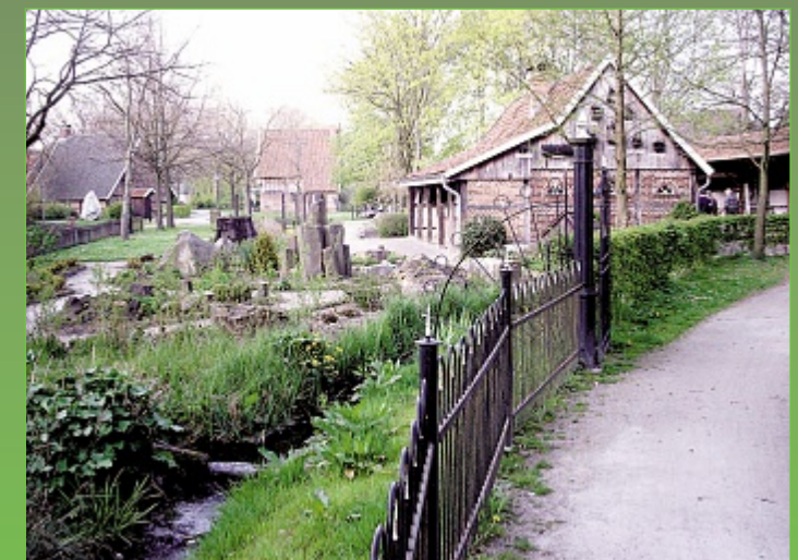
Parkgelände / Werkstattgebäude mit Ausstellungsvitrinen