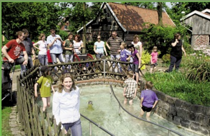
Kneippsches Tretbecken mit eiskaltem Quellwasser