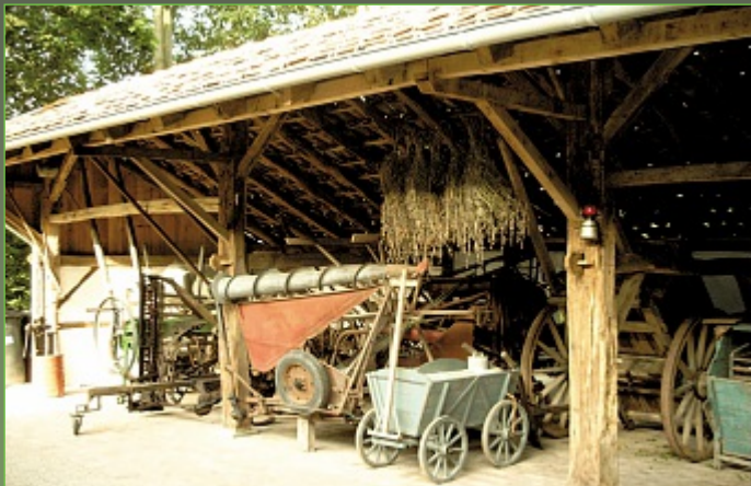
Ausstellung von historischen landwirtschaftlichen Geräten