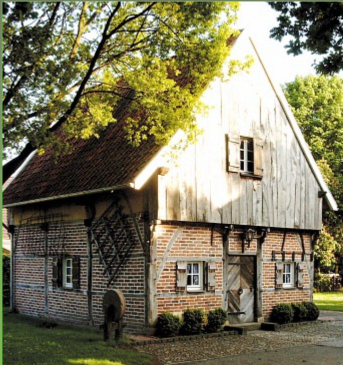
Backspeicher aus dem Jahre 1850

Der Backspeicher, ein Kornspeicher etwa aus dem Jahre 1850, stammt vom Hof Kortbuß aus Ahaus, Wüllen-Oberortwick. An seinem alten Standort konnte er nicht erhalten werden. Zur praktischen Nutzenanwendung wurde er deshalb abgetragen und von 1995 bis 1998 am jetzigen Standort wieder aufgebaut. In dem Backofen werden gelegentlich Steinofenbrote gebacken, die dann verkauft oder nebenan im Heimathaus zum Verzehr angeboten werden.