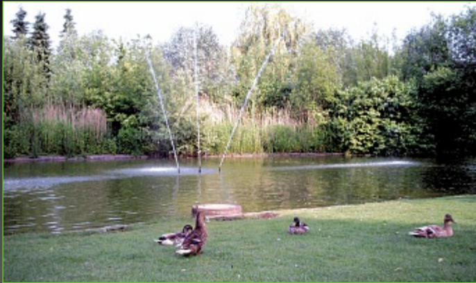
Ententeich im Quellengrundpark