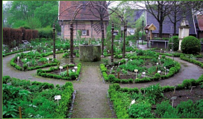
Blick in den Apothekergarten